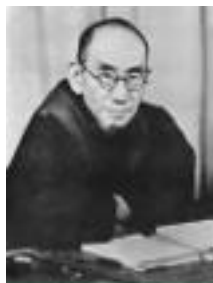
NISHIDA Kitarō 西田幾多郎

In dieser Seminarreihe soll eine „Einführung in die japanische Philosophie“ gegeben werden. Dazu werden in Auszügen Texte von NISHIDA Kitarō (1870-1945), TANABE Hajime (1889-1962), NISHITANI Keiji (1900-1990), UEDA Shizuteru (1926-2019), KUKI Shūzō (1888-1941) und WATSUJI Tetsurō (1889-1960) gelesen und zentrale Begriffe der japanischen Philosophie erläutert, wie z.B. das absolute Nichts/Leere, die reine Erfahrung oder die Spezies, um nur einige wenige Begriffe zu nennen. NISHIDA und TANABE gelten als Begründer der sog. Kyōto-Schule,