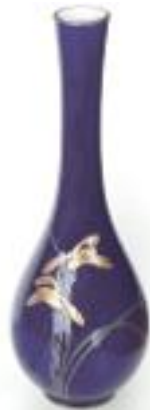
Blau mit Gold: Kōransha-Vase mit Iris-Dekor.

Farben dienten u.a. zur Kennzeichnung des Hofrangs und der gesellschaftlichen Hierarchie; einige Farbtöne waren – ähnlich wie Purpur im Westen – bestimmten Personengruppen bzw. Schichten vorbehalten. Die geschmackvolle farbliche Zusammenstellung der verschiedenen Lagen eines Hofgewandes galt in der Heian-Zeit (794-1185/1192) als Ausdruck von Kultiviertheit und Eleganz; selbst im 21. Jahrhundert ist dieser Gedanke beim Koordinieren der zum Kimono passenden Utensilien spürbar. Neue Farben, Färb- und Herstellungsmethoden ab der Edo-Zeit (1603-1868) eröffneten zusätzliche gestalterische Möglichkeiten. Dabei sprechen Farben die Sinne an, vermitteln Emotionen und Botschaften und begegnen uns in Japan in Religion und Literatur, Kunst und Kunsthandwerk, im Alltagsleben und in vielen anderen Bereichen.